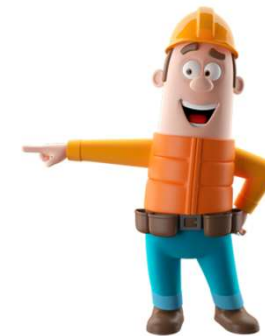
Rappresentante dei Lavoratori per la Sicurezza