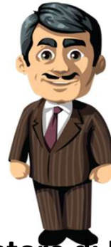
Datore di Lavoro