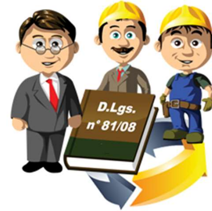
Servizio Prevenzione e Protezione